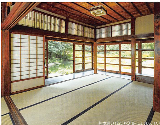
熊本県八代市 松江軒(しょうじょうけん)