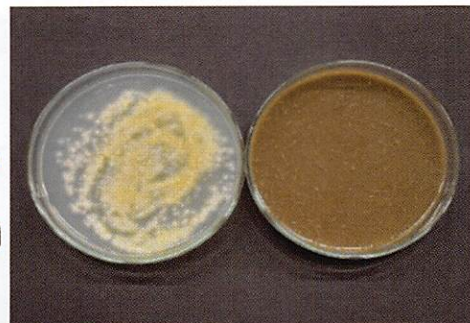
(白癬菌を両方に植えても、い草がある方は生えない。)

い草には水虫の原因となる白癬菌や足の臭いの原因となる微生物、大腸菌 O157 などに対して抗菌効果があります。